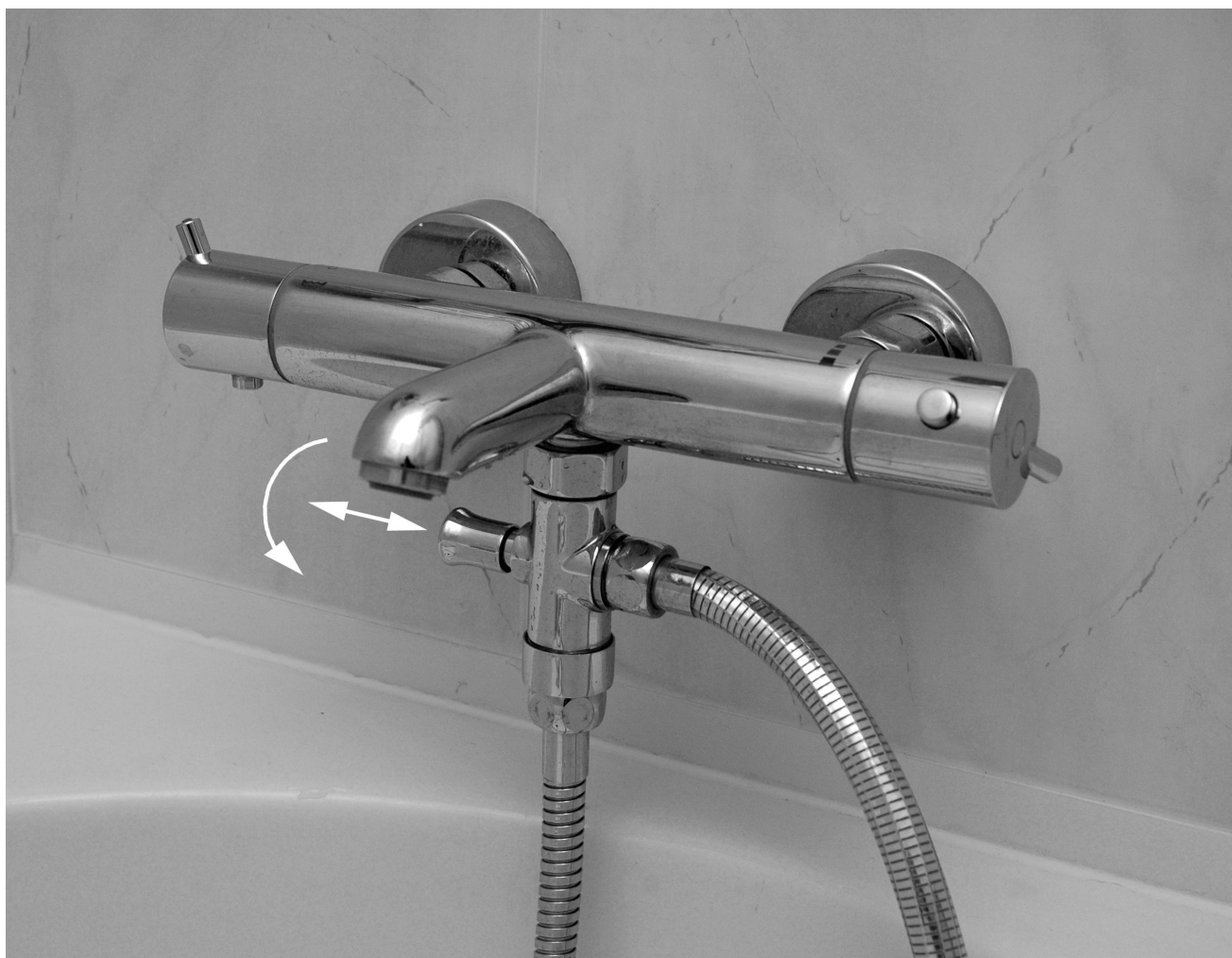
Sprchový přepínač namontovaný na sprchovou baterii

Dovozce: CZ BMI, s.r.o., IČO: 26759659, DIČ: CZ26759659